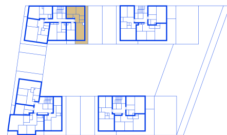
schéma umístění bytu