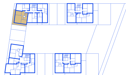
schéma umístění bytu