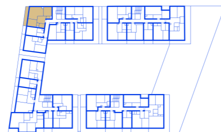
schéma umístění bytu