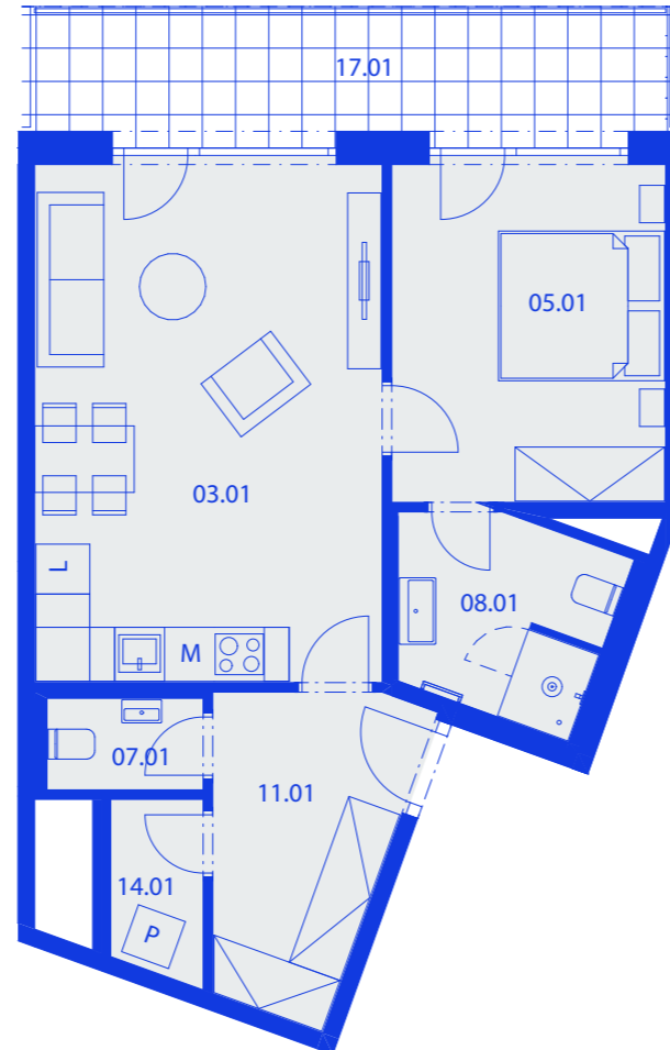
schéma umístění bytu