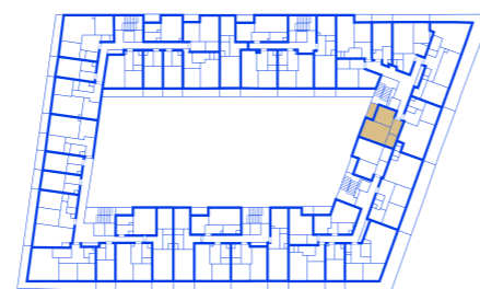
schéma umístění bytu