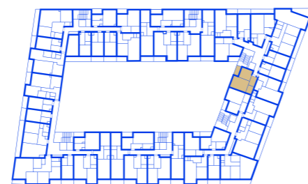
schéma umístění bytu