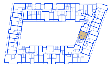
schéma umístění bytu