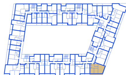
schéma umístění bytu