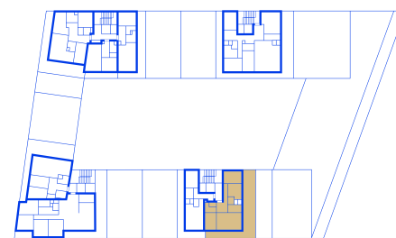
schéma umístění bytu