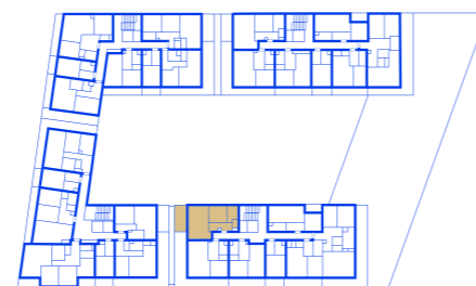
schéma umístění bytu