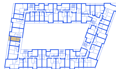
schéma umístění bytu